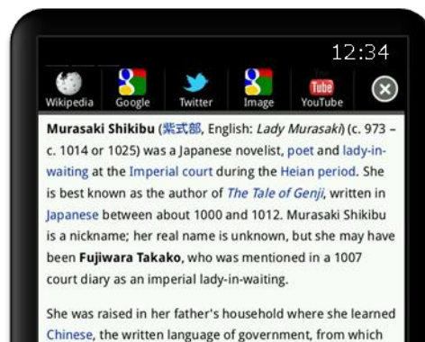
（画面イメージ 2）タップしたキーワードの関連情報を一画面に表示します。