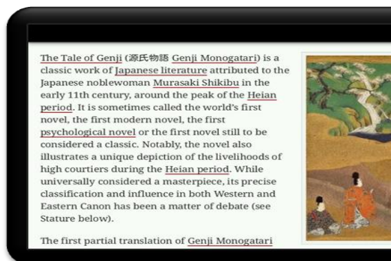
（画面イメージ 1）キーワードがリンク化され、タップ可能になります。